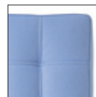
Particolare cuciture Stitching detail